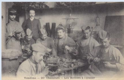
Vendôme – 20 ème Chasseurs – Les Bottiers à l'Atelier